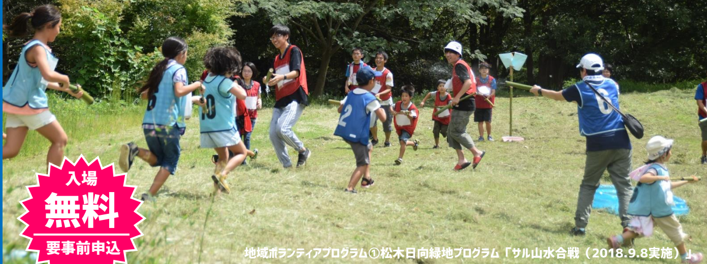
地域ボランティアプログラム①松木日向緑地プログラム「サル山水合戦（2018.9.8実施）」